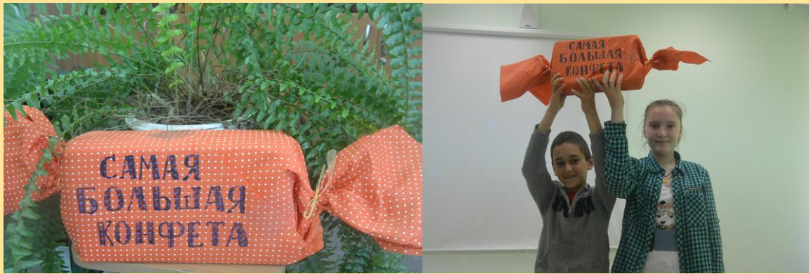
Самая большая конфета для отрядов «Истоки» и «Комета»

На заключительное мероприятие приехали гости из Лесного царства. Лесная царица со своей свитой окропили родниковой водицей участников мероприятия. Каждый отряд показал по два номера.