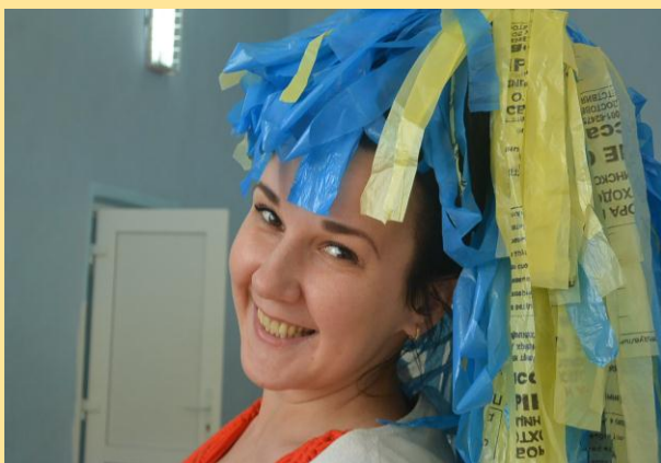
Президент Банка Солнечного города

На протяжении всей лагерной смены жители «Солнечного города» зарабатывали «солнышки» (валюта лагеря) и хранили свои сбережения в Банке Солнечного города.