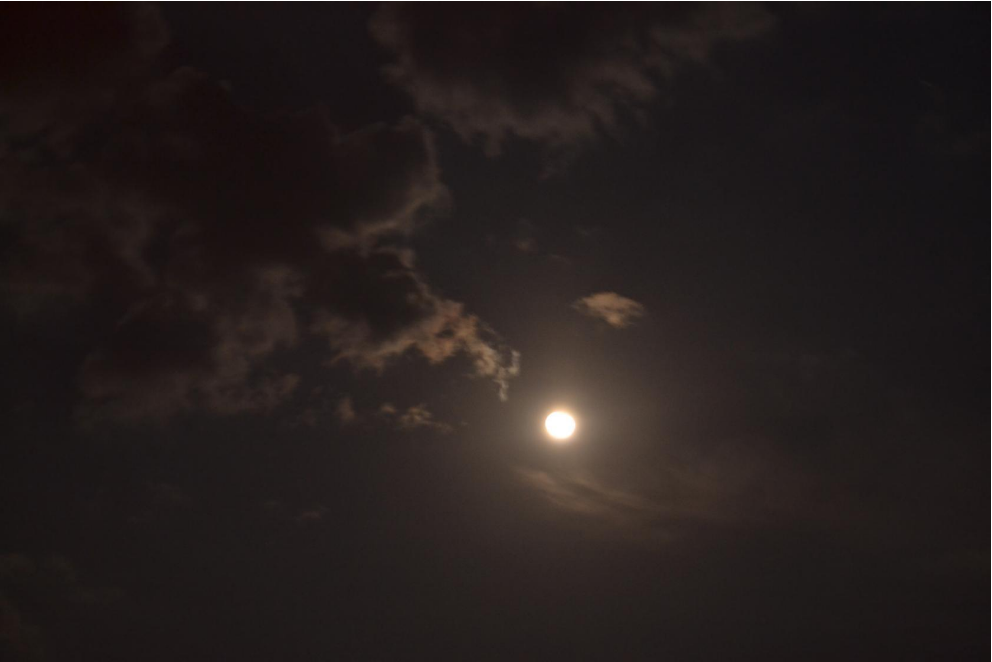
Заскучала в небе тёмном одинокая Луна