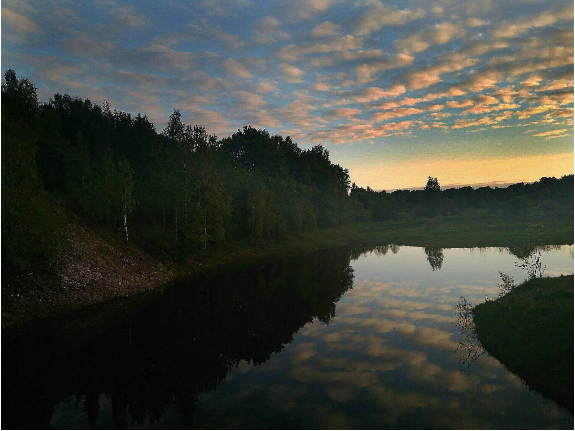
В реку смотрятся облака