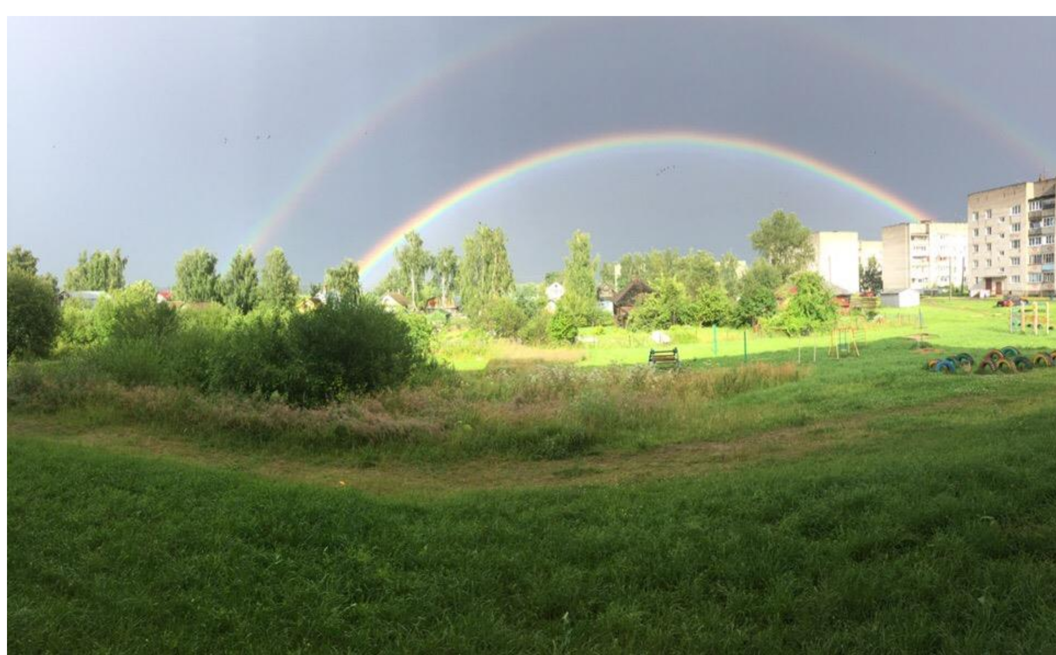
Подружился лучик солнышка с дождём