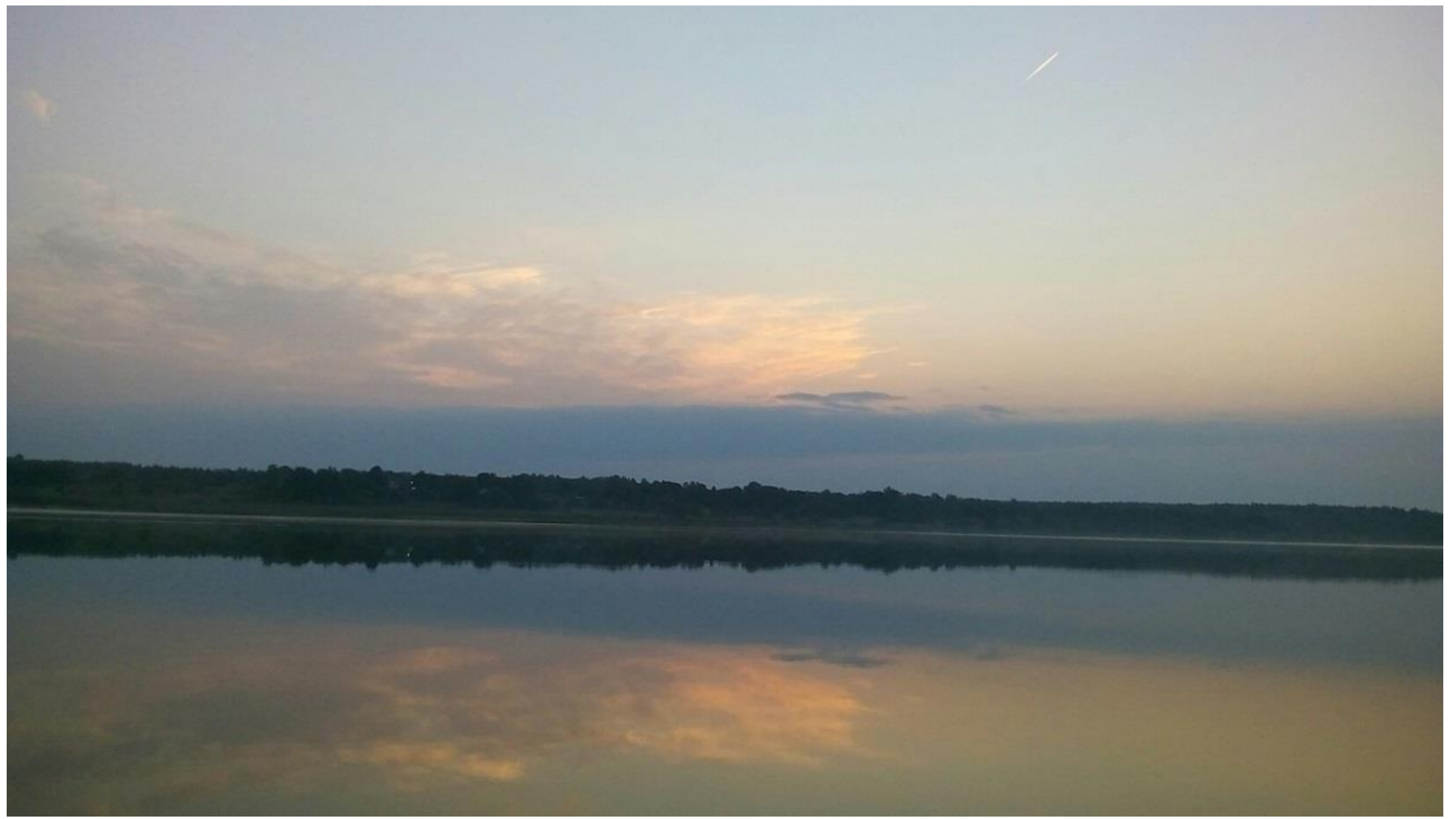
Бежит красавица-река, в ней дивно небо отразилось